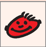
Kinder und jugendliche Spieler